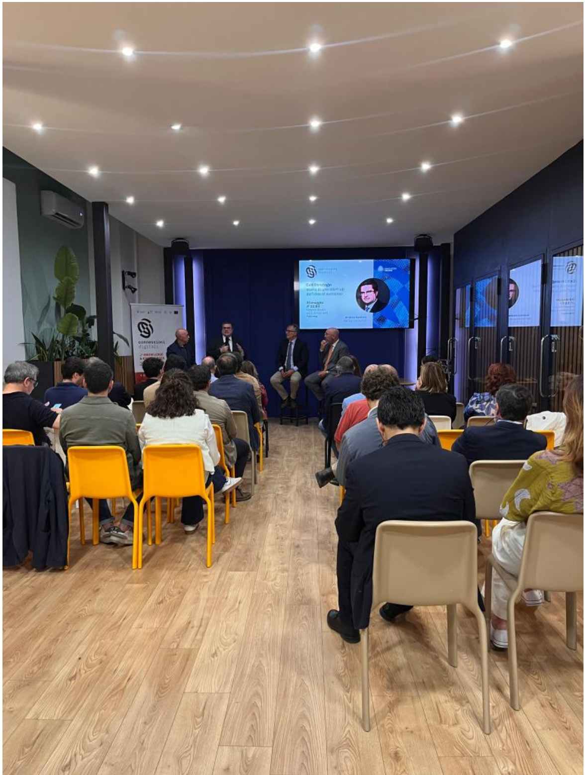
Conessioni Digitali a Palermo