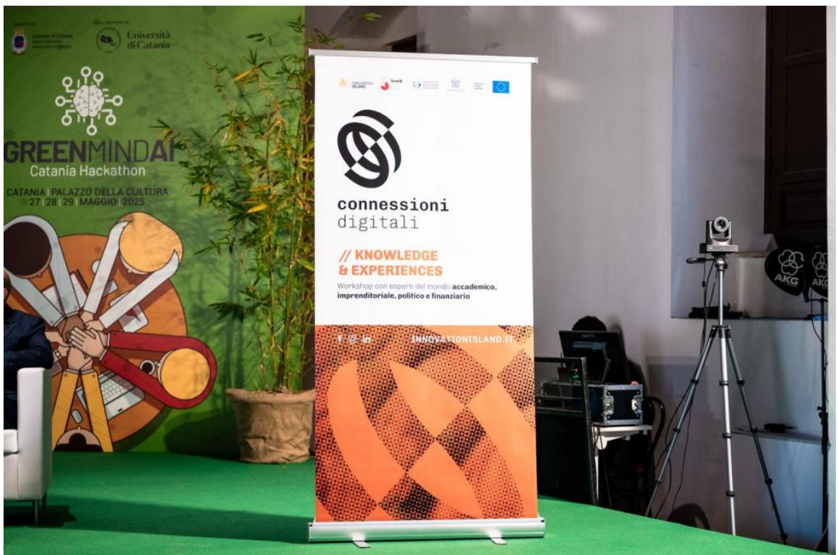
• Connessioni Digitali a Catania