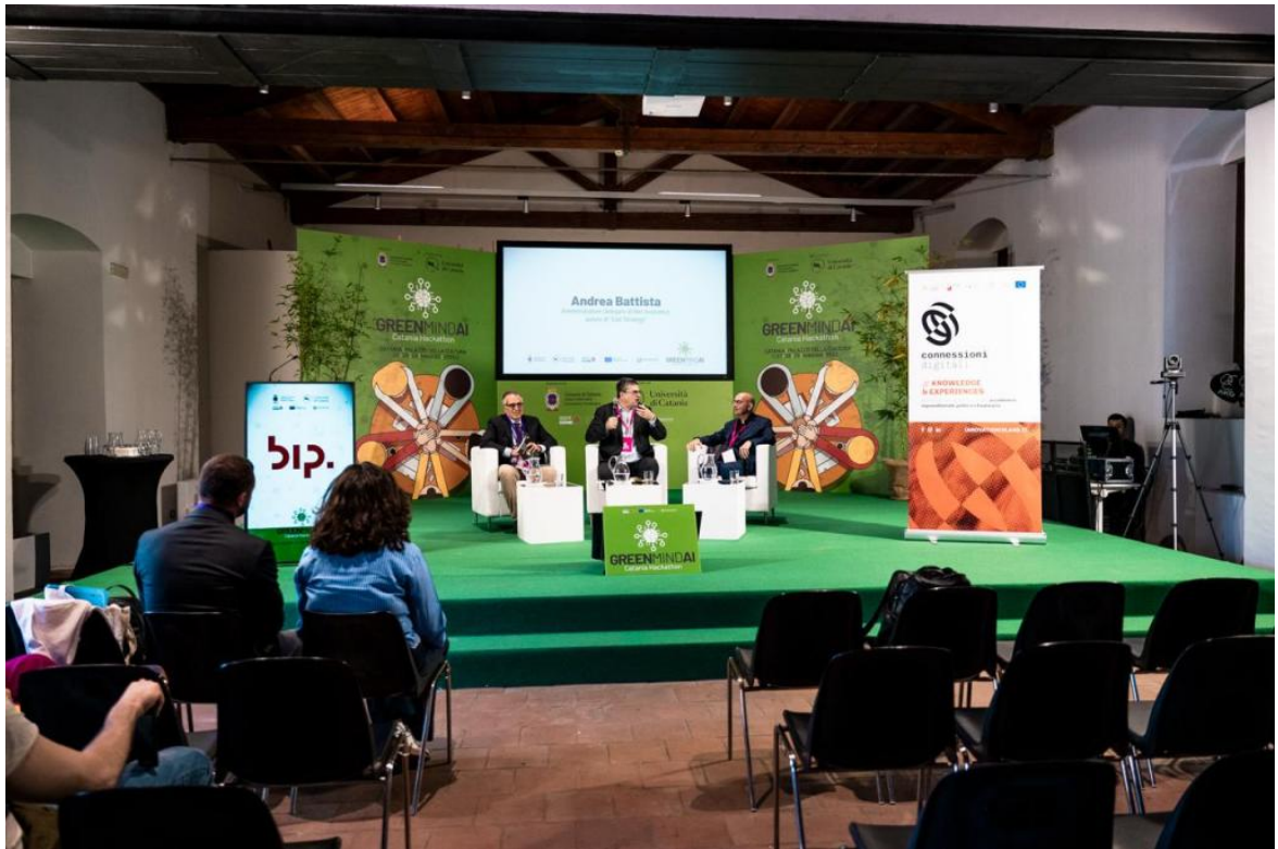
• Connessioni Digitali a Catania